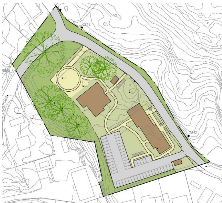
Figur 2: Illustration av föreslagen markanvändning.