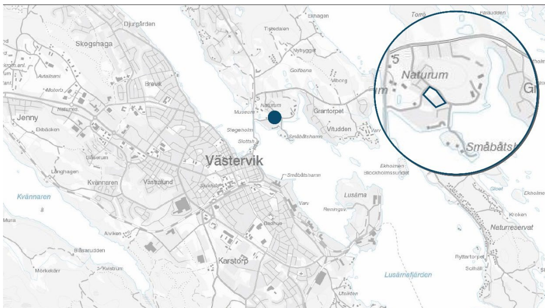
Figur 1: Planområdets lokalisering i förhållande till Västerviks tätort.

Planförslaget ska pröva möjligheten att ersätta befintlig verksamhet (segelmakeri) och gräsplanen med flerbostadshus. Inom planområdet planeras för ny bebyggelse i form av flerbostadshus i form av punkthus och/eller lamellhus bestående av fyra till sex våningar. Flerbostadshusen planeras möjliggöra för cirka 40 - 50 nya bostäder med tillhörande gårdar och kompletterande bebyggelse. De huvudalternativ till bebyggelse som utretts under planarbetets gång är dels ett punkthus i norra delen av planområdet, dels ett lamellhus längs Tändsticksvägen i södra delen av planområdet.