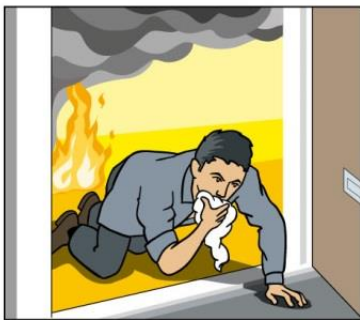
Brinner det och du inte kan släcka – ta dig ut.