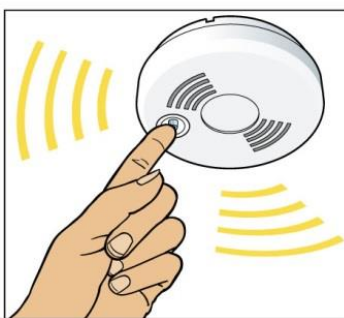
Testa brandvarnaren varje månad genom att trycka på testknappen.