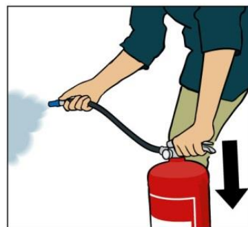
Tryck ner handtaget.