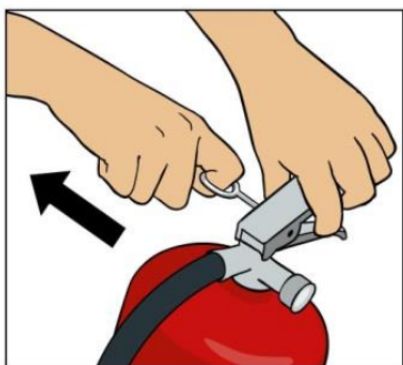
Dra ut säkringen.