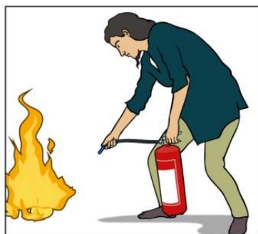
Rikta mot lågornas bas.