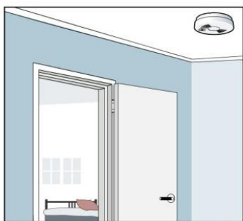
Brandvarnaren ska sitta i taket.