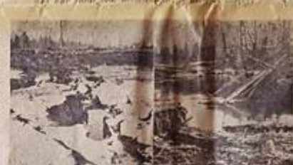
Som om en rindare jordbrukare står fram för det utvidgade Yxern på fjärra ställen. Markerna har strökat och sjöns djupdjupgräver strökat med i vatten.

— Men för detta bli det enda utskottet. Vi kommer att göra reglering hos Söderbygdens vattenmyndighet, ty våra intressen här är lika beaktade som rosparrarna.